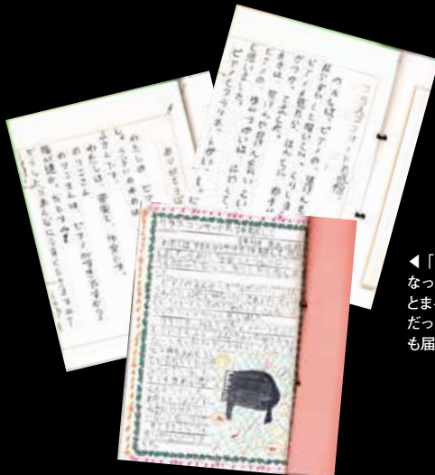
◀「ピアノがもっと好きになった!」「いつものピアノとまるで違って魔法みたいだった!」と生徒の生の声も届いた。