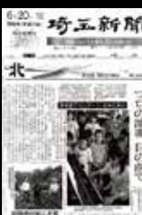
◀6月20日付埼玉新聞にも掲載 ▲「どうしてそんなに速く弾けるの?」「あれ弾いて!」と次々に声がとぶ