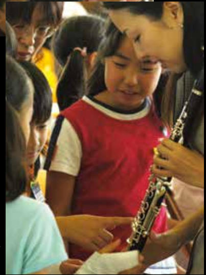
▶演奏者や楽器を近くでふれあえるのも少人数ならではの