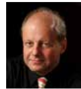
ヴォルフガング・マンツ (ドイツ) ニュルンベルク音楽大学教授