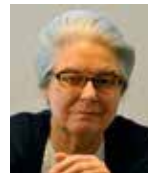
ディアヌ・アンデルセン (ベルギー) ブリュッセル王立音楽院名譽教授