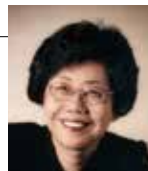
シン・スジョン (韓国) 元ソウル国立大学音楽学部長