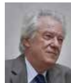
アキレス・デル・ヴィーニョ (イタリア) ロッテルダム音楽院・ザルツブルク夏季国際アカデミー教授