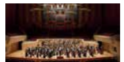
日本フィルハーモニー交響楽団